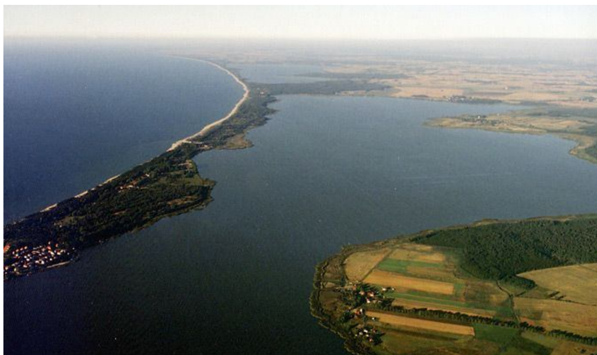
Widok z lotu ptaka na Łazy pomiędzy morzem a jeziorami Jamno i Bukowo.

Przestrzenna struktura miejscowości. Łazy posiadają stosunkowo luźną zabudowę, zarówno na obrzeżach jak i w centrum znajdują się pola namiotowe, kempingowe i ośrodki wypoczynkowe otoczone terenami zielonymi, boiskami itp. Przy niektórych ulicach istnieją skupiska domków jednorodzinnych. Układ przestrzenny miejscowości przypomina literę T, z centralnym punktem skrzyżowaniem drogi powiatowej z ul. Leśną w postaci dużego ronda. W części miejscowości położonej na zachód od ronda ciągną się domki jednorodzinne (gł przy ul. Wczasowej). Na południe od ronda w kierunku Osiek i Koszalina także są liczne domki jednorodzinne. Centrum miejscowości wzdłuż ul. Leśnej na wschód od ronda do głównego wejścia na plażę zdominowały sezonowe restauracje, bary, smażalnie, obiekty handlowe i atrakcje dla turystów. Na wschodnim krańcu miejscowości występują niemal wyłącznie ośrodki wczasowe i kempingowe.