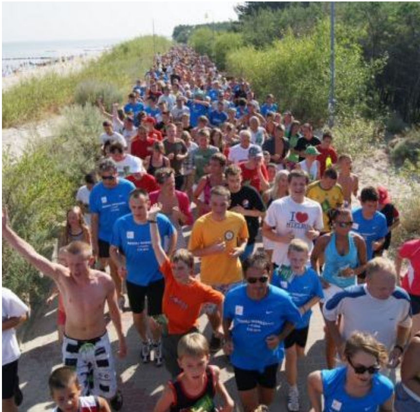
„Bieg śniadaniowy” na promenadzie w Mielnie

Promenada nadmorska jest niewątpliwie jedną z największych atrakcji turystycznych Mielna. Pierwsze odcinki powstały na początku XX w. Promenada była wielokrotnie rozbudowywana na całej długości tzw. „Starego Mielna” i w latach osiemdziesiątych liczyła ok. 1600 m. Obecnie jej długość wynosi w zasadzie ok. 800 m od ul. 1 Maja do ul. Orła Białego. Odcinek pomiędzy ul. Orła Białego i Mickiewicza osunął się podczas sztormów w końcu lat osiemdziesiątych. Końcowa część, od ul. Mickiewicza do ul. Pogodnej w Unieściu, została w ten sposób odcięta od reszty promenady. Centralny odcinek promenady, na wysokości ul. Kościuszki jest miejscem wielu imprez, ze Złotem Morsów na czele. W latach 2009-2010 miejsce to zostało gruntownie przebudowane, powstało nowe zejście na plażę z kładką łącząca dwa odcinki promenady, tarasy widokowe oraz pomnik morska. Miejsce to stało się odtąd nową wizytówką Mielna. Gmina Mielno opracowała wieloetapową dokumentację techniczną odbudowy i modernizacji całej promenady nadmorskiej, jednak kluczowe znaczenie ma odbudowa odcinka łączącego istniejące odcinki, pomiędzy ul. Orła Białego a Mickiewicza.