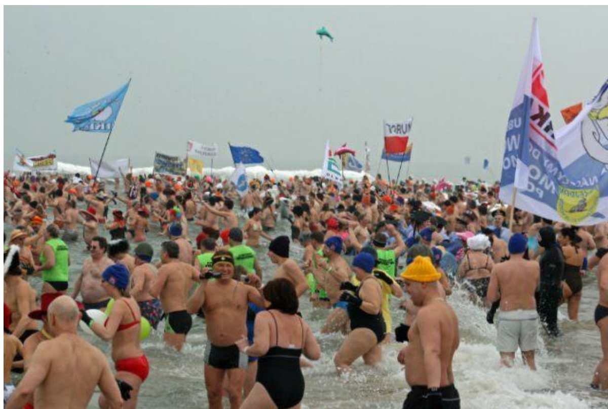
Międzynarodowy Złot Morsów 2010.

Koszty przedsięwzięcia to ok. 200 tys. zł rocznie. Uwzględniając 7-letnią perspektywę Planu Odnowy Miejscowości (do 2017 r.), przyjmuje się że koszty realizacji przedsięwzięcia w latach 2010-2017 wyniosą ok. 1 400 tys. zł.